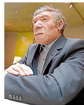
Recreación de un neandertal

En una nota de prensa, la UNED explica que hasta hace un par de años, la comunidad científica pensaba que los neandertales