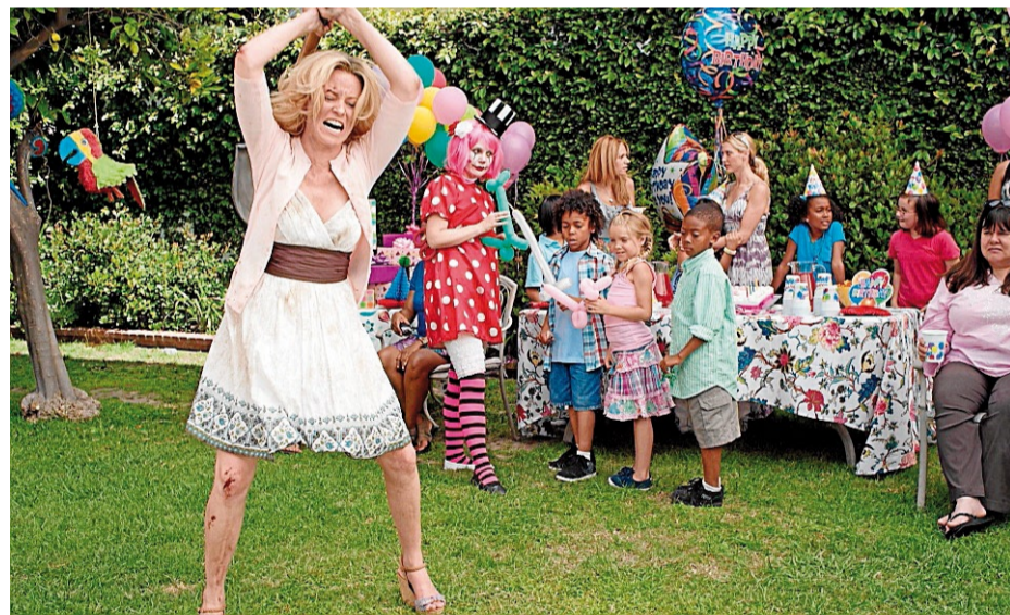
La actriz Elizabeth Banks en una secuencia de 'Movie 43', peor película del año

Tras los galardones de la Academia, Hollywood distingue las peores películas y actores del año